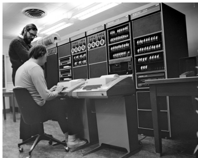
Ken (assis), Dennis (debout) devant un PDP-11, 1972

“something as complex as an operating system, which must deal with time-critical events, had to be written exclusively in assembly language”